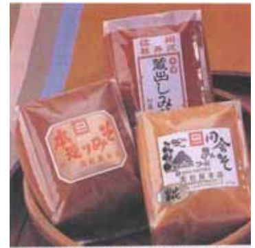
本造りみそ(赤みそ1kg袋詰) 田舎みそ(白みそ1kg袋詰) 各 840円 蔵出しみそ(赤みそ1kg袋詰) 735円

中山道・沓掛宿にて昔より味噌の販売を営んでおり、軽井沢の別荘のお客様に『信州味噌』のお店として長年ご愛顧を頂いております。